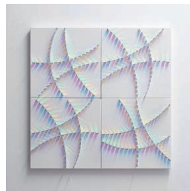
Ceilidh / Chris Wood