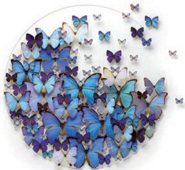
AESTHETICA MOSAIC / Christopher Marley

https://www.u-presscenter.jp/article/post-42448.html