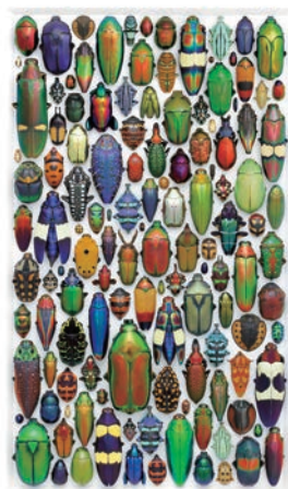
AESTHETICA MOSAIC / Christopher Marley